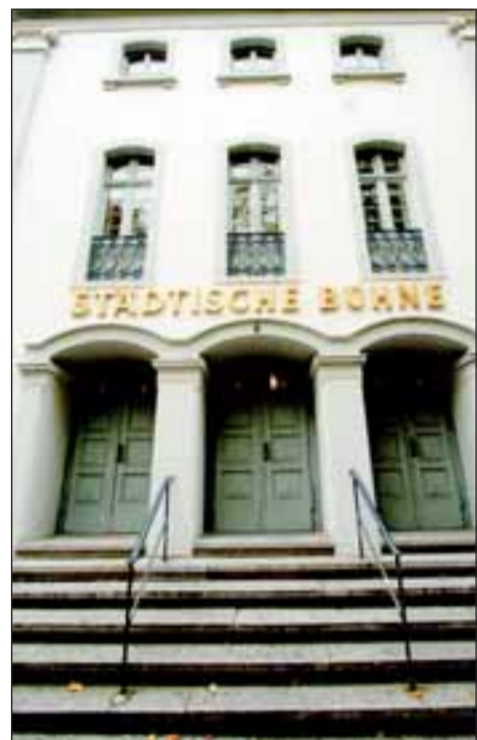
Ab Sommer 2009 wird das Städtische Theater saniert. Dann sollen auch die Haupttüren wieder geöffnet werden.