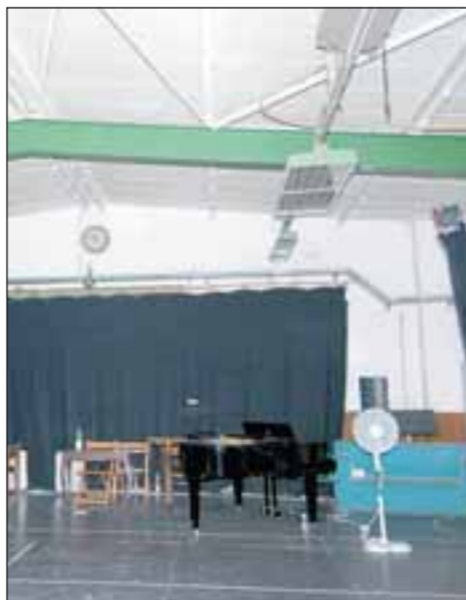
Wer hätte da gedacht, dass die Akteure in solch einer trostlosen Industriehalle unter widrigen Bedingungen proben müssen...