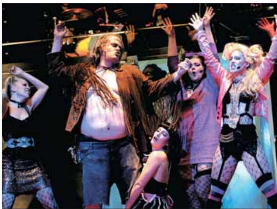
So farben- und lebensfroh wie hier bei der Rocky Horror Picture Show geht es abends auf der Bühne des Theaters zu.