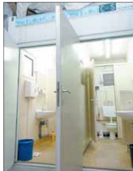
..., oder dass sie nach schweißtreibenden Szenen nur solche Toiletten zur Verfügung haben?