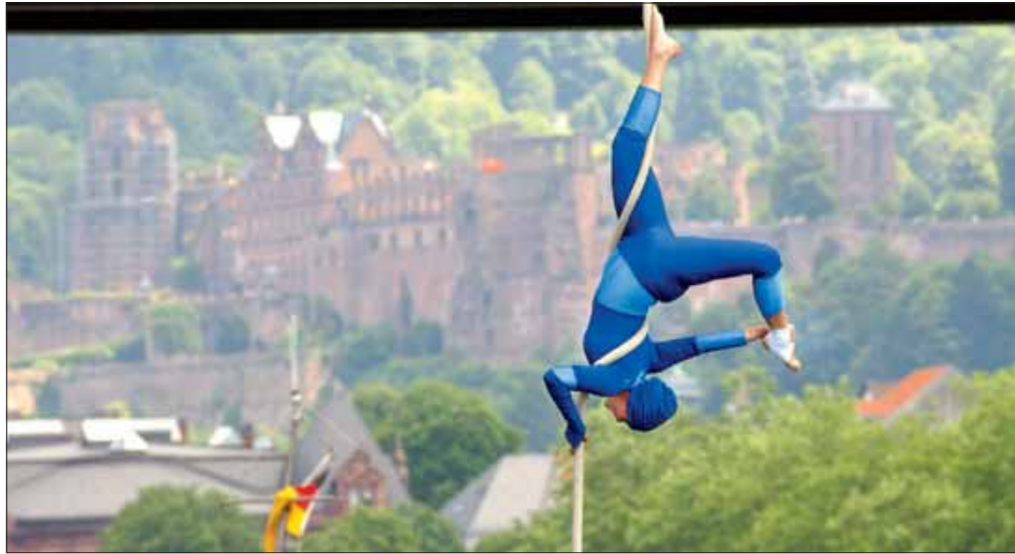
Auch die Artisten des Kinderzirkus Peperoni werden beim „Festival des Sports“ wieder ihre Kunststücke zeigen.