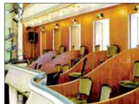
Details aus dem Zuschauersaal: Die Rosette (mit einer Aussparung für die Scheinwerfer), die Kassettendecke, die Lampen unter den Rängen und die Stühle im ersten Rang.