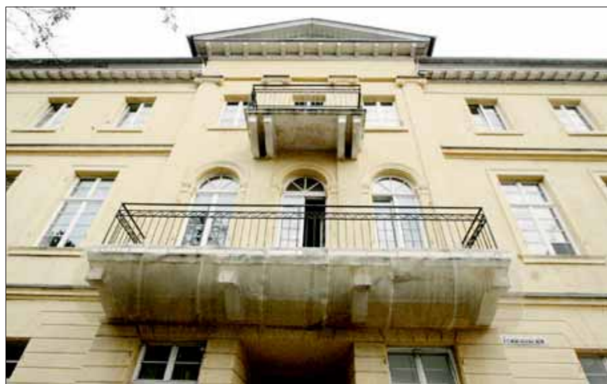
Die Frage ist: Was passiert mit dem Haus Friedrichstraße 5? Hier hat unter anderem der Intendant bislang sein Büro (der Balkon muss wegen Mängeln gesichert werden), hier ist aber auch eine kleine Spielstätte untergebracht. Das Gebäude ist denkmalgeschützt, aber stark sanierungsbedürftig.

müssten zwar nicht geopfert werden, aber 20 Prozent der Theaterfreunde hätten immer noch eine schlechte Sicht. Sollte die aber verbessert werden, dann ist das nur unter erheblichen Eingriffen in die denkmalgeschützte Bausubstanz möglich. Ein umfangreicher Ausbau des Theatersaals wäre die Folge, verbunden mit dem Umbau der Bühne, Wegfall von Plätzen, Absenkung des Fußbodens usw. Die großen Eingangstüren blieben bei der Umsetzung dieses Konzeptes geschlos-