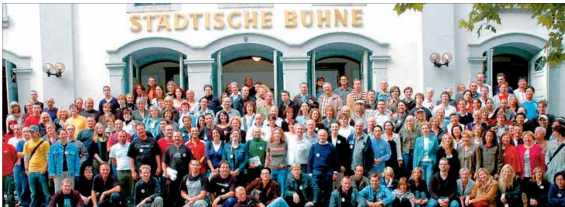
Das Städtische Theater hat 285 Mitarbeiter, die teilweise unter schlimmsten Bedingungen arbeiten. Für sie und für die Zuschauer muss die Spielstätte saniert werden.