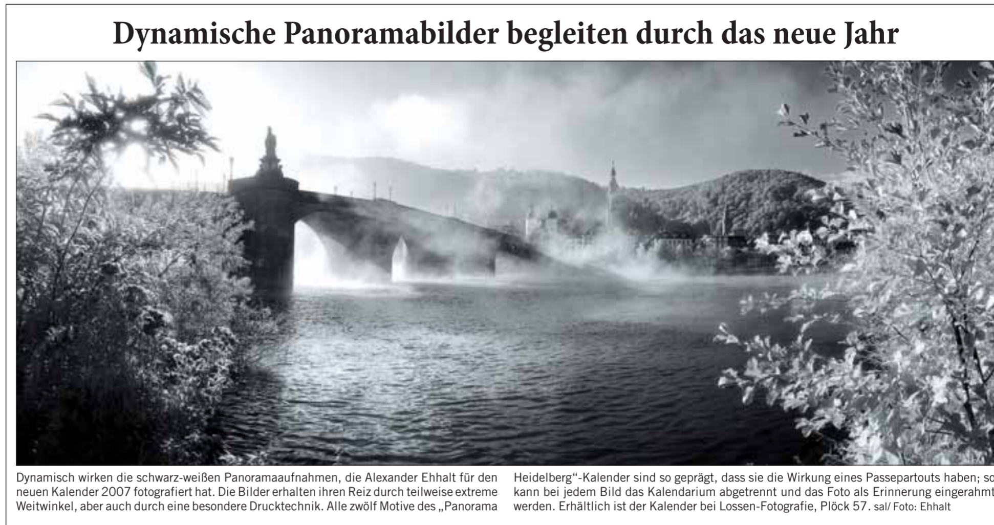
Dynamisch wirken die schwarz-weißen Panoramafotografien, die Alexander Ehhalt für den neuen Kalender 2007 fotografiert hat. Die Bilder erhalten ihren Reiz durch teilweise extreme Weitwinkel, aber auch durch eine besondere Drucktechnik. Alle zwölf Motive des „Panorama

Wir wollen die Geowissenschaften an beiden Standorten so konzentrieren, dass in Karlsruhe mehr in Richtung Ingenieurwissenschaften gelehrt wird, in Heidelberg mehr in Richtung Naturwissenschaften. Die Studenten werden aber nach Er-