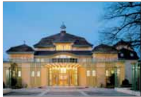
Jugendstil-Kleinod: die Halle in Leimen.

Weil das Theater die Festhalle mietfrei bekommt und nur die Sachkosten wie Heizung und Reinigung bezahlen muss, revanchiert es sich mit Sonderprei-