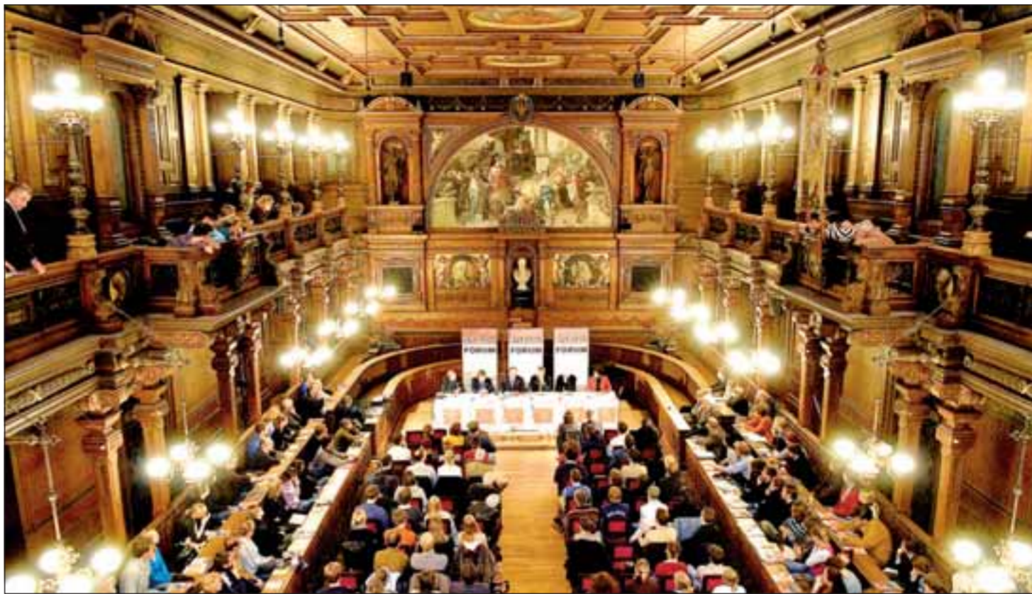
Studierende haben großes Interesse, wenn es um ihre Universität und ihre Zukunft geht: Beim Spiegel-Forum zum Thema „Elite-Unis“ war die Alte Aula am Montag Abend entsprechend gut besetzt.

Gawrisch hatte die undankbare Aufgabe, die Entscheidung der Kommission zu vertreten. Das tat er denn auch mit Nachdruck: „Wir brauchen eine weltweit wettbewerbsfähige Forschung; wir müssen jetzt die Konzepte der Zukunft entwickeln, und Breitenforschung nutzt uns nichts, wenn anderswo, wie in Shanghai