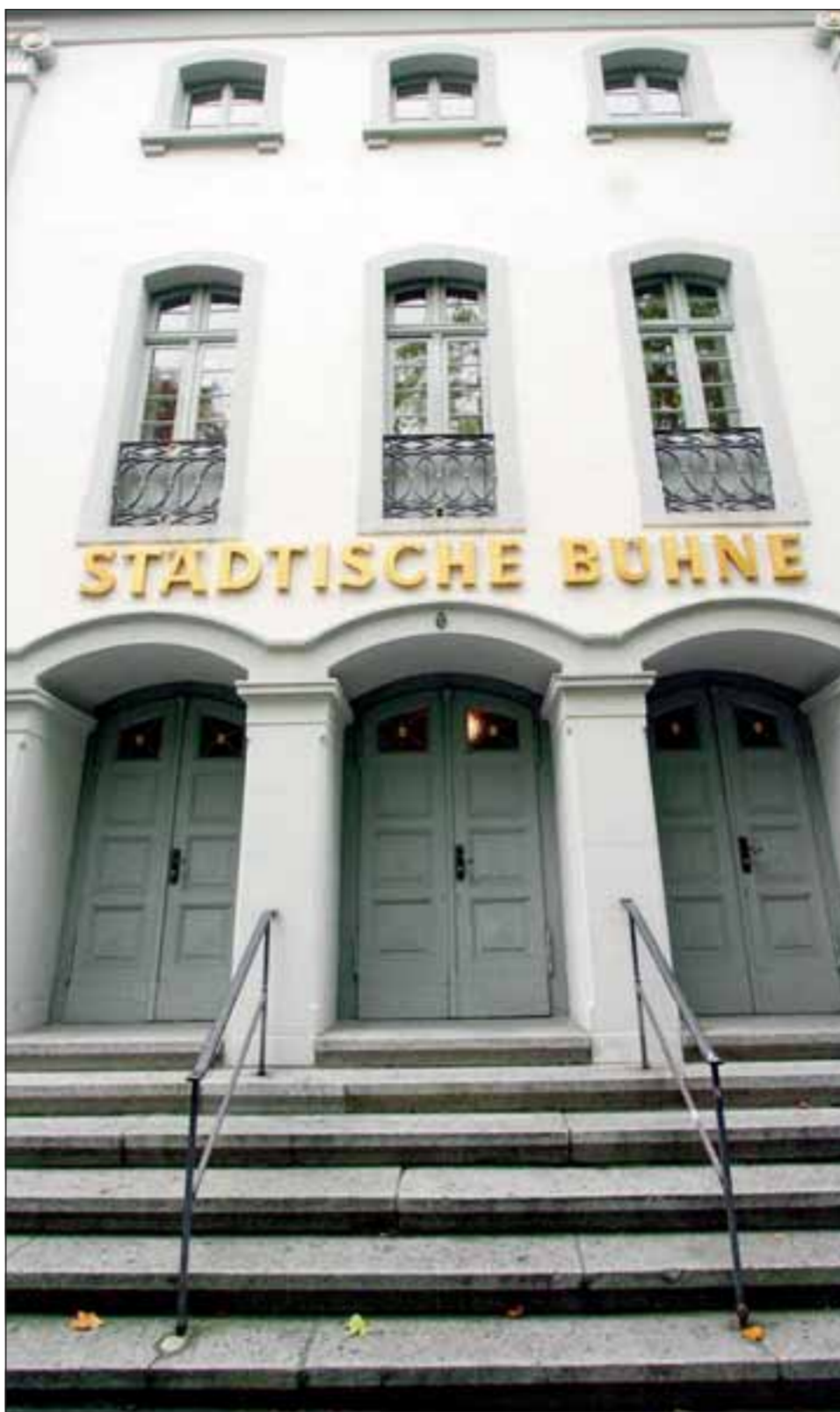
Verschlossene Türen bei der Städtischen Bühne: Das Herzstück des Theaters darf bis auf Weiteres nicht mehr genutzt werden.